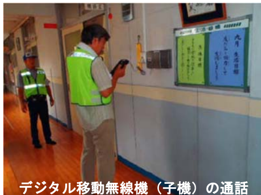
デジタル移動無線機（子機）の通話