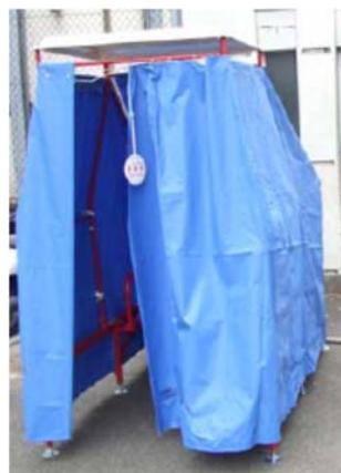
くみ取り式 仮設トイレ（洋式）