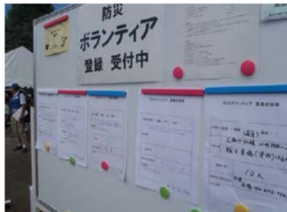
ボランティア情報