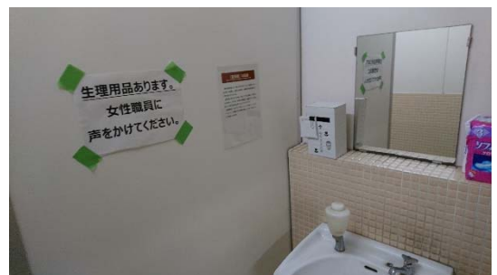
トイレに設置した意見箱

◇ 多様なニーズの把握のために、声を出しにくい人の声を拾うための意見箱の設置や民間支援団体等との連携によるニーズ調査等の工夫が考えられます。