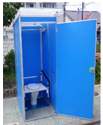
下水直結式 仮設トイレ