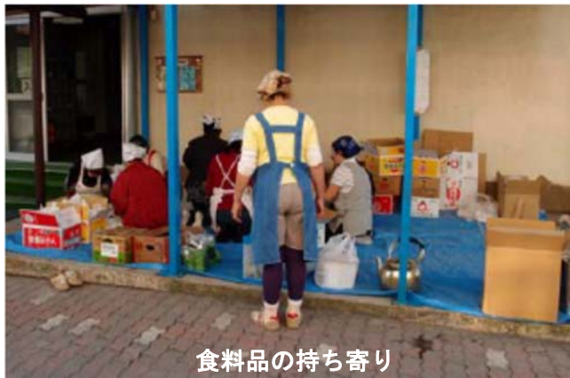
食料品の持ち寄り

※おおむね発災 4 日目で降、水道局職員が断水状況を踏まえ、順次、仮設の蛇口を取り付けます。