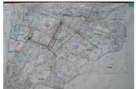
町内会の被災状況