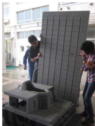
くみ取り式 仮設トイレ（和式）